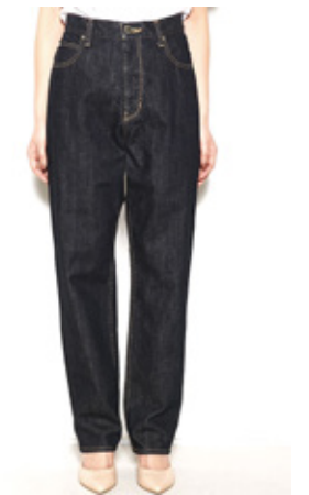
KONA One wash DENIM ¥16,200- / BLACK BY MOUSSY