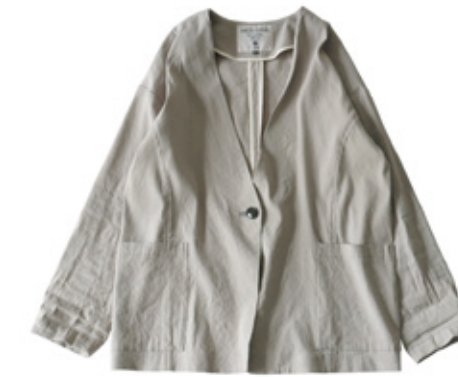
No Collar Linen Jacket ¥29,160- / MICA&DEAL