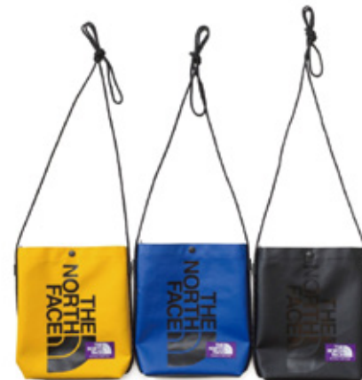
TPE Shoulder Pocket ¥6,264- / THE NORTH FACE PURPLE LABEL