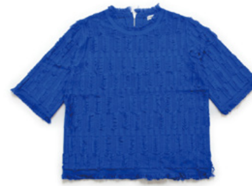
Short Sleeve Knit ¥12,960- / FRAY I.D

女性らしさをテーマに、日常で着られるモード、上質なカジュアルウェア、品のあるフォーマル・ドレス。女性のあらゆる場面で「今着たい」と感じられる洋服をセレクトしました。