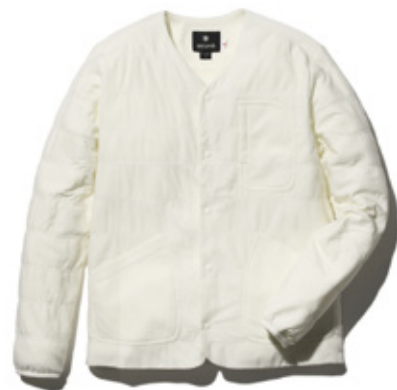
Flexible Insulated Cardigan (M/W) ¥21,600- / SNOW PEAK

テーマはデイリーカジュアル。ベーシックで飽きのこないアイテムを中心に、アウトドアやスポーツのエッセンスを加えたセレクトをユニセックスで展開します。リニューアルオープンにあたり、THE NORTH FACEなど新ブランドもラインナップに加わります。