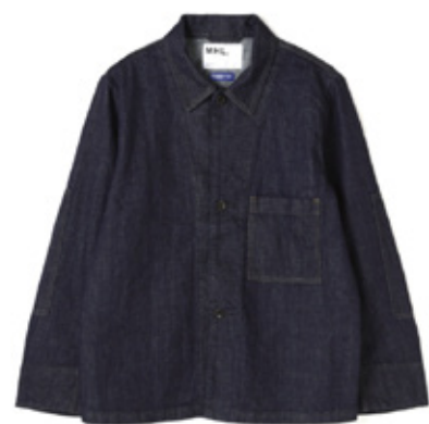
CANTON DENIM ¥41,040- / MHL.